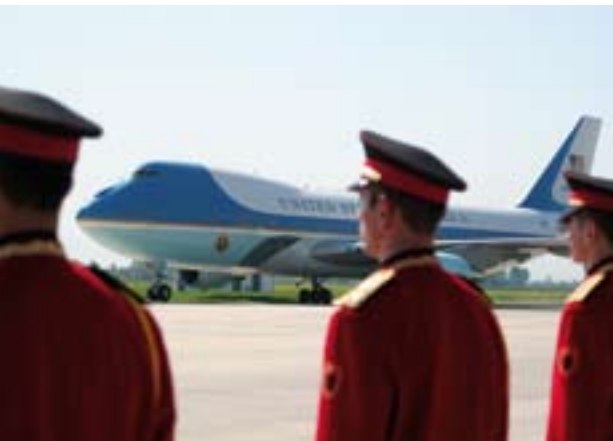
Air Force One, aeroplani zyrtar i Presidentit të SHBA-së i parkuar në pistën e Aeroportit Ndërkombëtar të Tiranës më 10 qershor 2007

TIA garantoi uljen dhe ngritjen e sigurtë të njërit prej avionëve më të mëdhenj në botë, një Boeing 747-200B. Me përfundimin me sukses të vizitës së Presidentit Bush, aeroporti shënoi një hap tjetër për arritjen e standardeve europiane, duke treguar që është i aftë të presë avionët më të mëdhenj në botë. Krahas akomodimit të avionit të veçantë dhe të pasagjerëve të tij, TIA ishte e aftë të siguronte operimin normal të 22 fluturimeve të programuara: asnjë fluturim nuk u vonua dhe as u anulua, pavarësisht pranisë së një numri të madh të forcave të sigurimit dhe procedurave të veçanta që duhej të ndiqeshin.