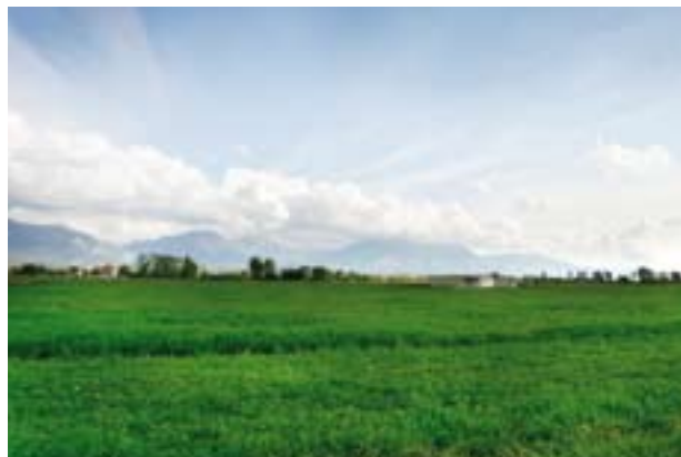
Përmirësime të punimeve në fushën e aerodromit