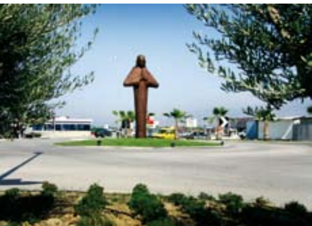
Monumenti i Nënë Terezës u ngrit më 13 shtator 2007, në mes të rrethrotullimit në Aeroportin Ndërkombëtar të Tiranës

Aeroporti, që mban emrin e murgeshës me famë Nënë Tereza, përuroi më 13 shtator 2007 një monument të humanitares së madhe. Monumenti është gjashtë metra i lartë dhe peshon dy tonë.