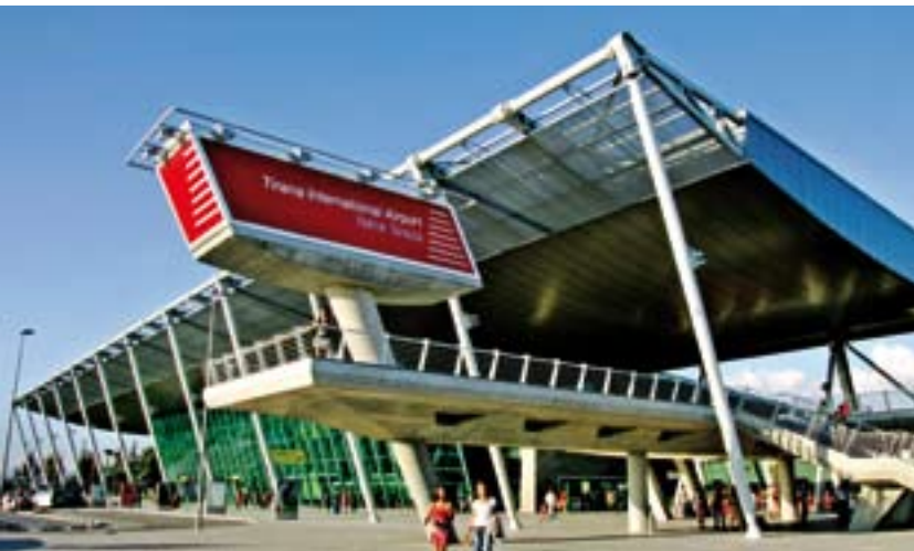
Aeroporti Ndërkombëtar i Tiranës

Hapja e terminalit të ri të pasagjerëve i projektuar me një kapacitet fillestar vjetor prej afërsisht një milion pasagjerësh. Terminali i ri u përrua më 21 mars 2007. Kjo kryevepër infrastrukturore, e përgatitur nga arkitekti malajzian Hin Tan, ka tetë dyqane dhe duty-free, lokale, restorante dhe bar-kafe. Për zonën e nisjes dhe të mbërritjes ka një restorant, ndërkohë që në sheshin jashtë terminalit, Piazza, një bar i mbuluar, i pajisur me një fasadë tradicionale shqiptare prej guri, ofron një pamje të këndshme dhe relaksuese të ndërtesës dhe të zonës përreth. Terminali i ri përmbush kërkesat më të sofistikuar dhe përbën një kontribut të madh për transformimin e Tiranës, kryeqytetit të Shqipërisë.