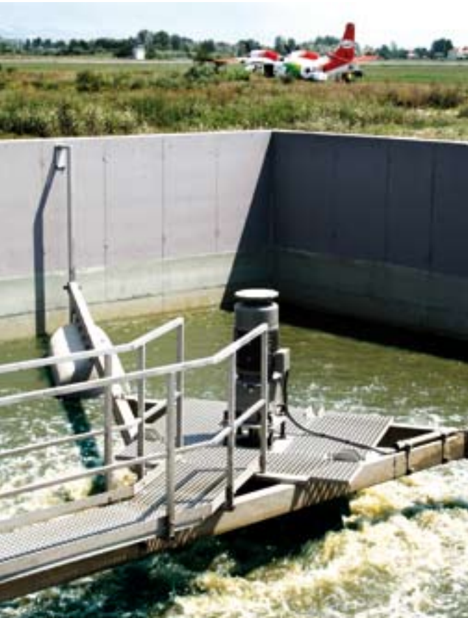
Pamje e impiantit të përpunimit të ujërave të zeza

Gjatë një periudhe shtatë javore nga fillimi i funksionimit të impiantit të trajtimit të ujërave të zeza, TIA monitoroi cilësinë e ujërave të zeza. Kampionët u morën në mënyrë periodike dhe u analizuan nga laboratorit i Agjencisë Shqiptare të Pyjeve dhe Mjedisit në Tiranë. Monitorimi i të gjithë parametrave u bë në përputhje me legjislacionin përkatës dhe lejen mjedisore për ndërtimin dhe funksionimin e impiantit të trajtimit të ujërave të zeza të miratuar nga Ministria e Mjedisit, Pyjeve dhe Administrimit të Ujit. Rezultatet e monitorimit shtatë javor treguan se standardet respektohen plotësisht.