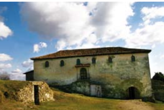
Në brendësi të kështjellës së Prezës

Në buletinin e parë, TIA informonte lexuesit lidhur me kërkesën për oferta për një plan për zhvillimin e turizmit për komunitetin e Prezës, në fillim të tetorit 2006. Ky projekt, ishte identifikuar nga TIA, si një veprim i vlefshëm për përmirësimin e cilësisë së jetës së banorëve përreth dhe për rritjen ekonomike të zonës. Që nga ajo kohë, është përgatitur një plan nga një firmë britanike konsulence, Goulds Properties UK Limited. TIA investoi 17,000 euro për këtë projekt. Me ndihmën e aeroportit, u organizuan takime mes autoriteteve lokale dhe firmës konsulente, si edhe me ministritë dhe autoritetet përkatëse, për të diskutuar projektin në detaje.