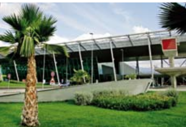
Pamje e Aeroportit Ndërkombëtar të Tiranës

Në këtë kuadër është ndërtuar edhe një sistem i dytë drenazhimi që lidhet me sistemin e ri qendror të drenazhimit.